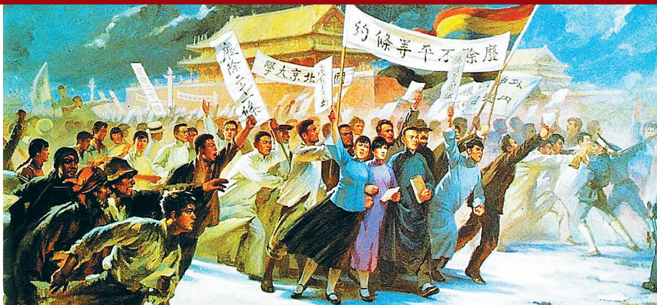
描绘五四运动的油画。