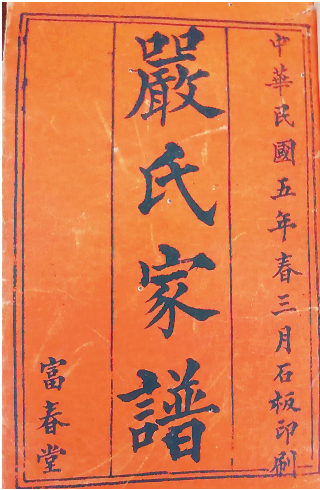
民国《严氏家谱》的封面。