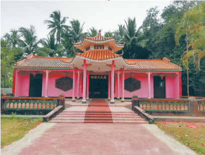
会西田村的严氏大宗祠。位于文昌清澜南海村委

600多年过去了，严其慎后人秉承忠孝、仁义等传统儒家道义，涌现出许多仁人志士，在他们身上，诗书礼仪、家国情怀等民族精神得以彰显。