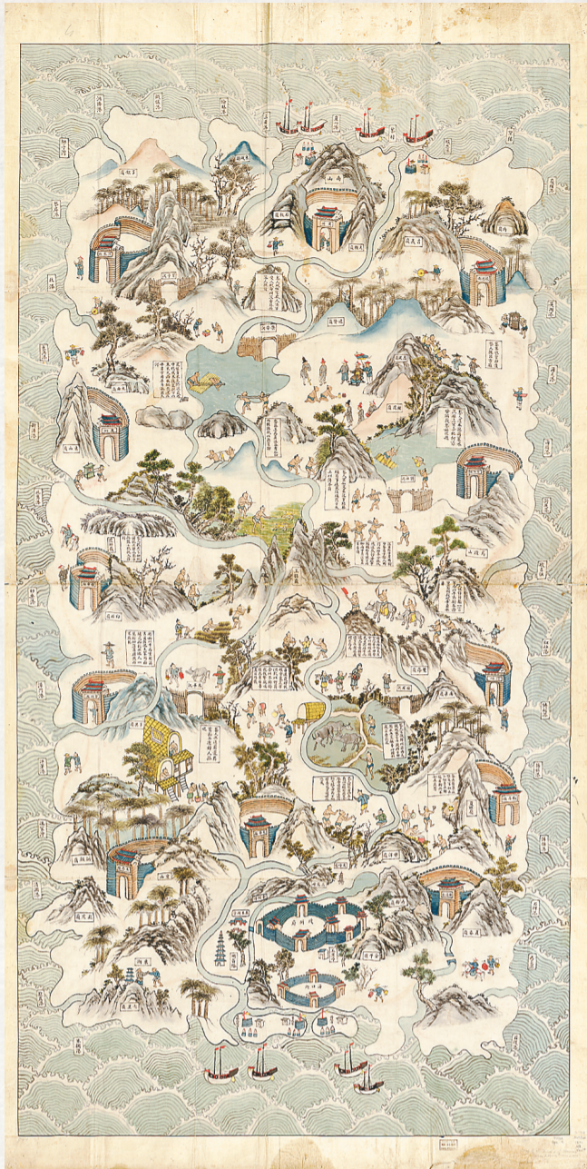
晚清《海南岛图说》。

要山水、城邑、港口、营寨、炮台及船舶。其中，镶嵌了大量美丽风光、以黎族人为主的二三十帧风俗情景，以及对其习俗的多个小方文字说明。