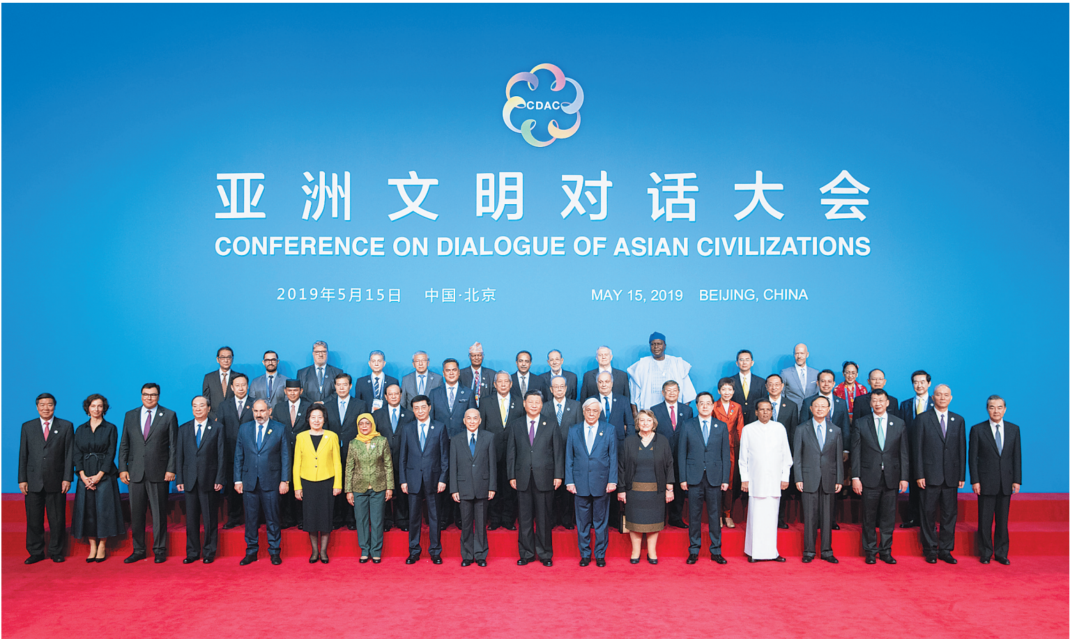
5月15日,国家主席习近平在北京国家会议中心出席亚洲文明对话大会开幕式,并发表题为《深化文明交流互鉴 共建亚洲命运共同体》的主旨演讲。这是开幕式前,中外领导人同出席开幕式的重要嘉宾代表合影留念。

习近平指出,中华文明是亚洲文明的重要组成部分。自古以来,中华文明在继承创新中不断发展,在应时处变中不断升华,积淀着中华民族最深沉的精神追求,是中华民族生生不息、发展壮大的丰厚滋养。中华文明是在同其他文明不断交流互鉴中形成的开放体系,始终在兼收并蓄中历久弥新。亲仁善邻、协和万邦是中华文明一贯的处世之道,惠民利民、安民富民是中华文明鲜明的价值导向,革故鼎新、与时俱进是中华文明永恒的精神气质,道法自然、天人合一是一是中华文明内在的生存理念。 习近平强调,今日之中国,不仅是