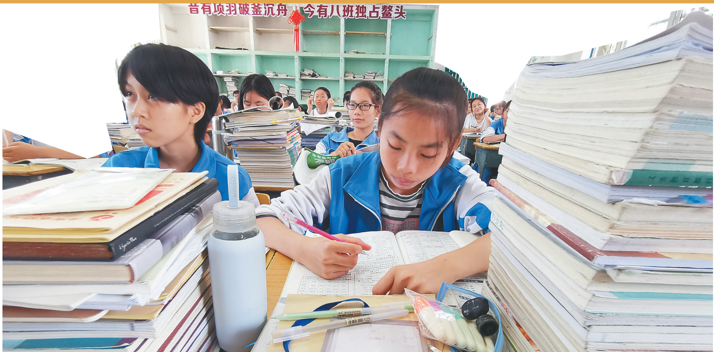
儋州市第二中学初三学生复习备考。本报记者 陈元才 通讯员 朱鼎甲 摄

上周《教育周刊》为考生们介绍了高考部分学科的冲刺技巧。目前距离我省中考不足40天,本期继续邀请我省中学名师对英语等学科中考复习支招。