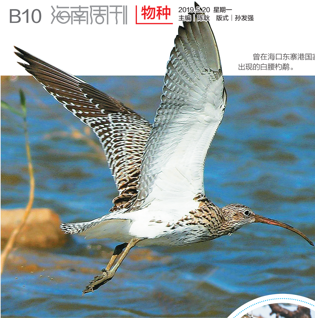
曾在海口东寨港国家级自然保护区出现的白腰杓鹬。（资料图片）