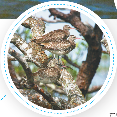
→栖息在海口东寨港国家级自然保护区中的杓鹬。