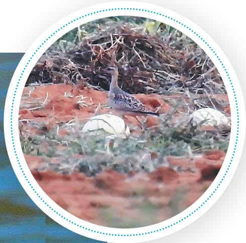
↑在海口市秀英区长流镇昌明村附近瓜菜地里拍摄到的小杓鹬。