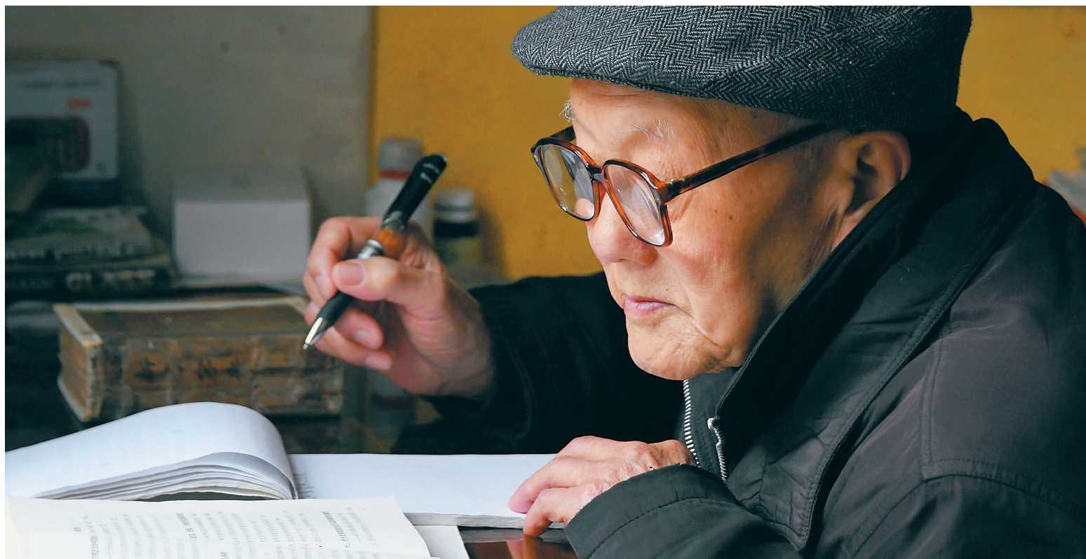
张富清在家看书学习(三月三十一日摄)。