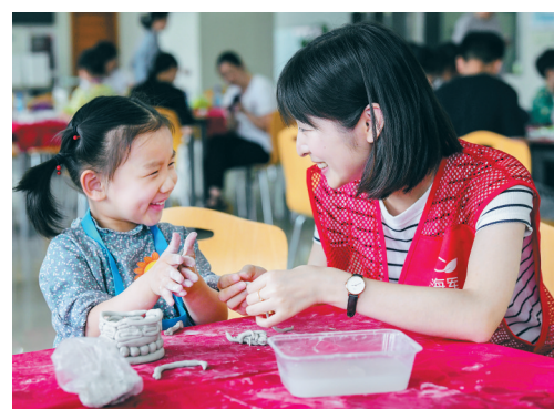
5月25日,小学生在志愿者指导下制作陶艺作品。

新华社北京5月25日电 日前,全国妇联、中央文明办、共青团中央、教育部、民政部、文化和旅游部、国家卫生健康委员会、国家广播电视总局等8部门联合下发《关于庆祝2019年“六一”国际儿童节的联合通知》,对今年的“六一”活动作出具体部署。