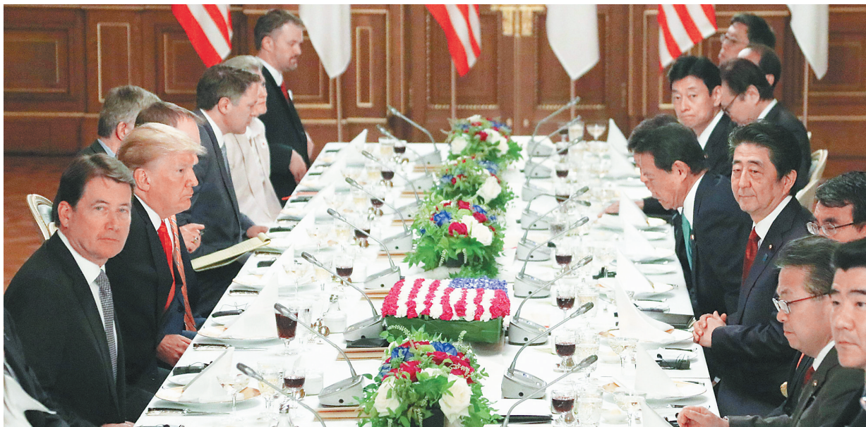
5月27日,在日本东京,日本首相安倍晋三(右四)与美国总统特朗普(左二)举行工作午餐。

当天上午,特朗普前往皇居会见日本德仁天皇和皇后,成为德仁天皇5月1日即位以来会见的首位外国首脑。