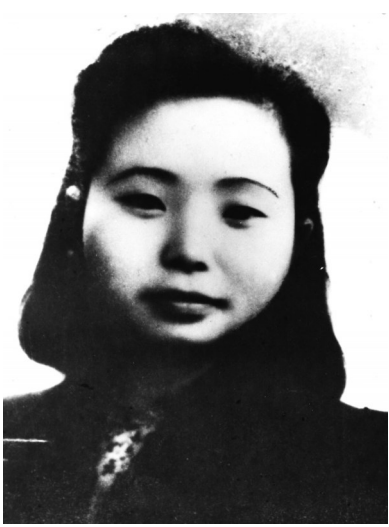
江竹筠像(资料照片)。

据新华社成都5月29日电 (记者吴晓颖)江竹筠,四川省自贡市人,1939年加入中国共产党。1943年,党组织安排她为当时中共重庆市委领导人之一的彭咏梧当助手,做通信联络工作。