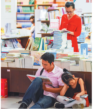
6月1日,家长带着孩子在新华书店阅读选购图书。