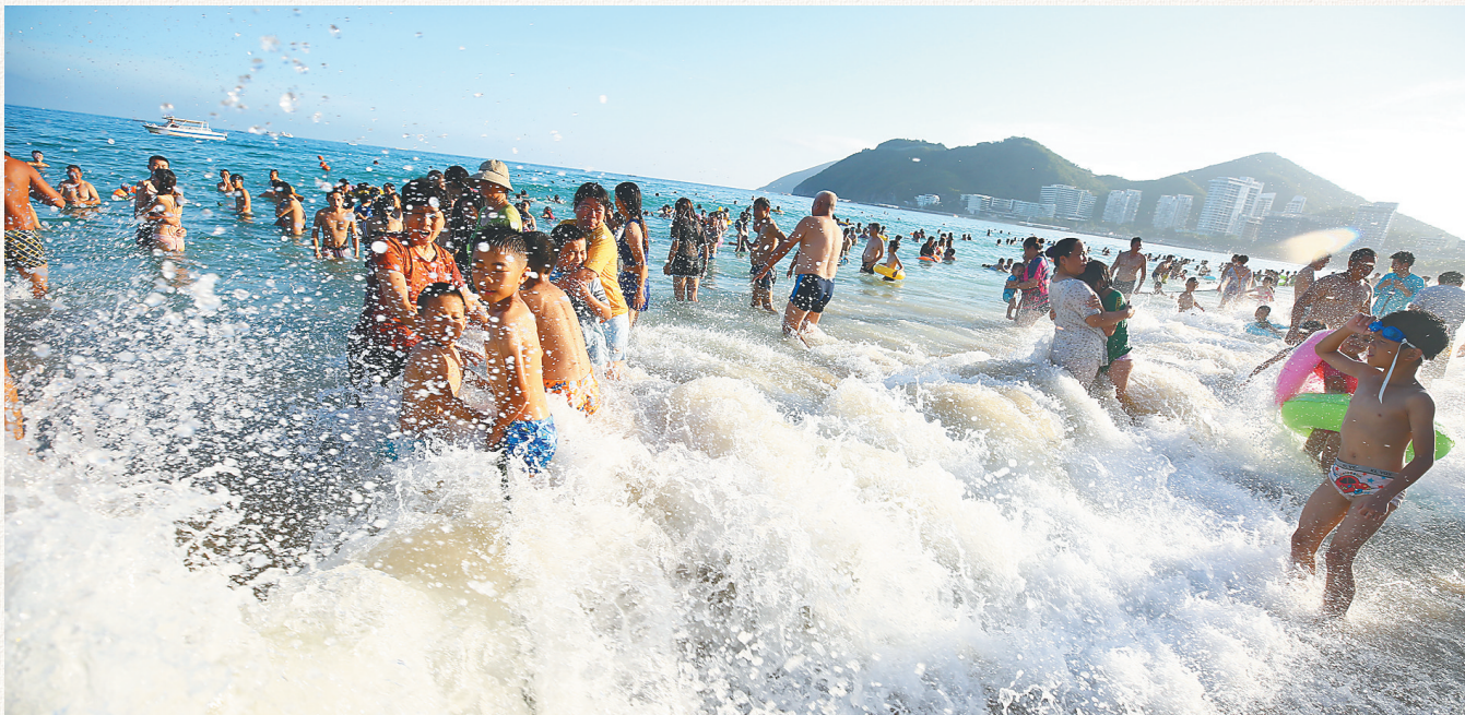
每年端午节都有大批海南居民到海边“洗龙水”。