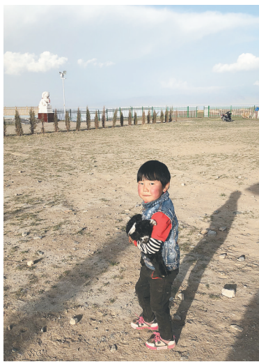
青海湖边的小男孩。