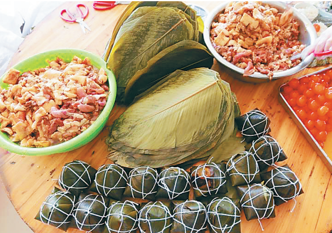
定安粽子料足味香。