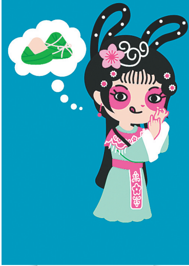
定安旅游形象大使“小青梅”与定安粽子。

其实,我们旅程之所以漫长,因为制作我们的人觉得,每一个定安粽子,都应该在匠心的熏陶下长大。 (本报策划/撰文 段誉)