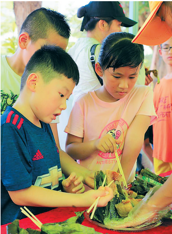
小朋友在定安粽子海口展销会上品尝定安粽子。

我的名字叫定安粽子,我的家坐落于美丽的南渡江畔——海南省定安县。从明代算起,我的祖祖辈辈生活在这已经数百年了。而从2010年开始,我登上“海南(定安)端午美食文化节”的舞台,让全海南,乃至全国的“吃货”们都知道了我的身份,可谓是“光宗耀祖”了呢! “吃货”们有所不知的是,从2010年开始,我和兄弟姐妹们就在“精细化生产”“标准化管理”下成长。别看我们只是一个粽子,从原材料选购,制作到进入人们的餐桌,我们可是要经历一场漫长的旅行呢。 在我的家乡定安,家家户户都会包粽子,但可不是每个定安人包出来的都是定安粽子。我“系出名门”,只有通过定安相关政府部门和定安粽子协会认证