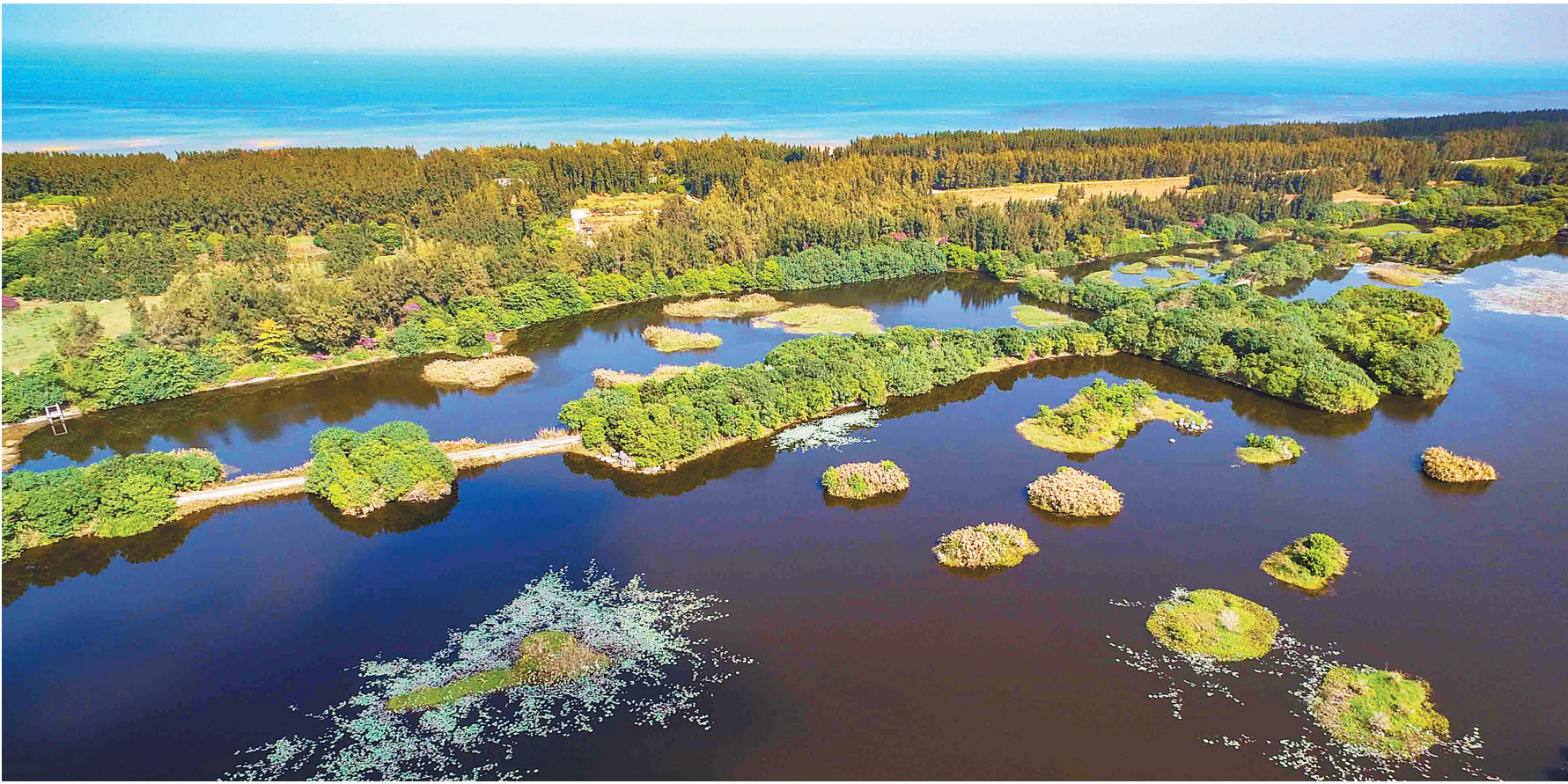
昌江海尾国家湿地公园。

近来,昌江着力推进各项环保工作,全县生态文明建设取得了良好成效。王下乡还被生态环境部评为全国第二批“绿水青山就是金山银山”实践创新基地,较好地树立了生态文明建设的标杆样板,发挥示范引领作用。