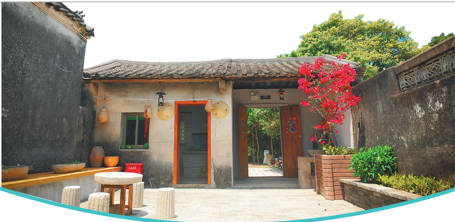
博鳌沙美村的民宿。