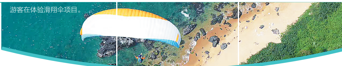
游客在体验滑翔伞项目。