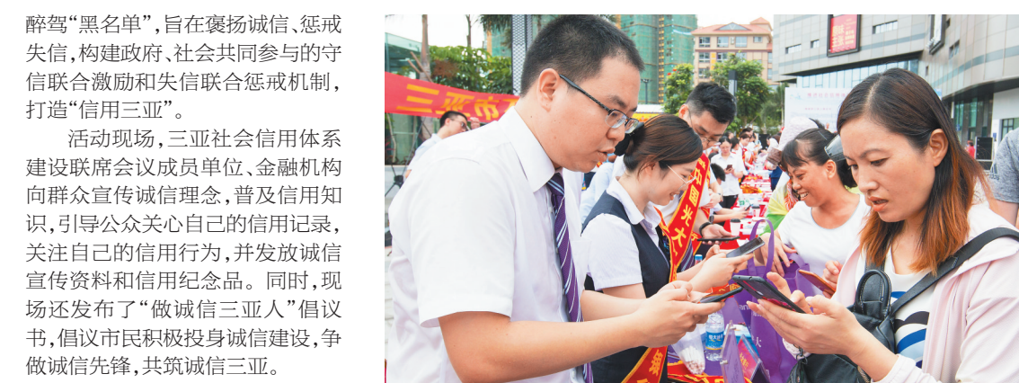
现场工作人员向市民讲解信用知识。