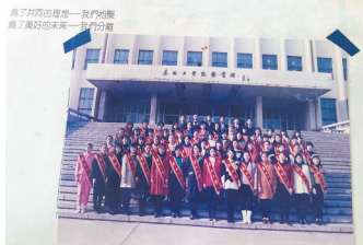
1990年代，东北大学毕业生纪念册里同学的签名和合照。