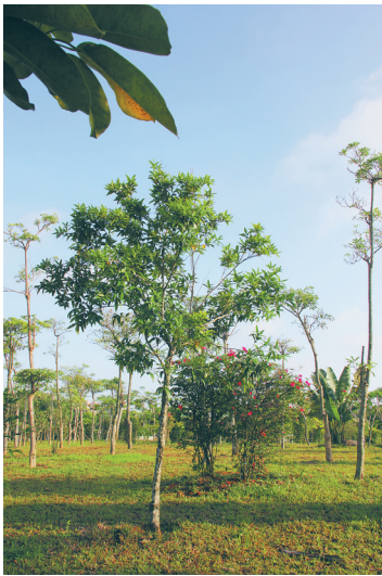
一棵3米多高的蒲桃小树。

有资料记录，我国自古就有用蒲桃果实煎水服用治疗腹泻和痢疾的习惯；在凉血止血方面，将蒲桃捣烂后用作外敷，对于因刀伤导致的小面积出血有一定效用。此外，蒲桃对于治疗热淋、牙龈肿痛、止渴除烦等病症也有一定的效果。但必须要特别说明的是，蒲桃虽说有药用价值，但大家遇到具体症状时，还是要选择到医院就医或咨询专业医生建议。