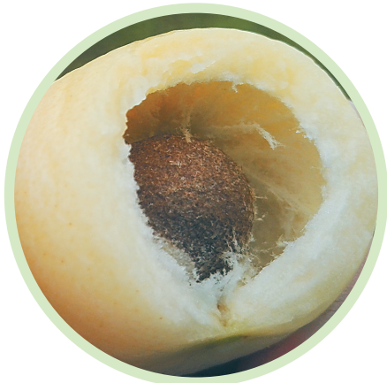
蒲桃的果实水不多，但味甜、微涩而回甘，让喜欢的人欲罢不能。