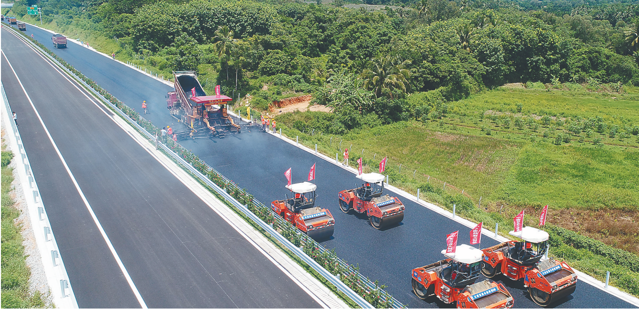
路面平整度平均误差不足一枚硬币的厚度,是文琼高速的一大亮点,也刷新海南公路纪录。图为中国铁建大桥工程局文琼高速路面项目摊铺施工现场。

周年,国家赋予了海南全面深化改革开放,建设海南自由贸易试验区、中国特色自由贸易港的新使命,中国铁建抢抓海南自贸区、自贸港建设新机遇,展现央企担当,在新的起点上加大投入,积极参与海南交通基础设施投资建设。