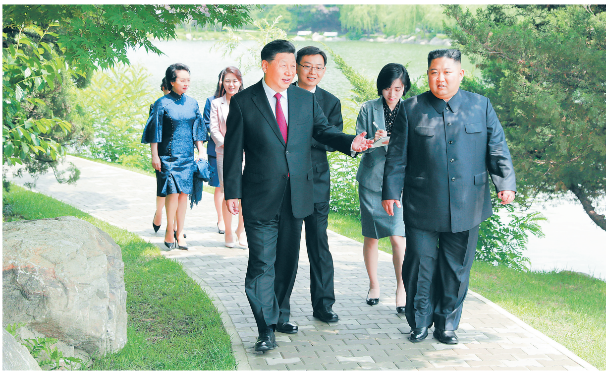
6月21日,中共中央总书记、国家主席习近平在锦绣山迎宾馆会见朝鲜劳动党委员长、国务委员会委员长金正恩。习近平夫人彭丽媛及金正恩夫人李雪主参加会见。会见前,习近平夫妇和金正恩夫妇在庭院内散步交谈。