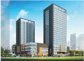
逸龙广场·九珑临街效果图

三亚,这个浪漫美好的国际滨海旅游城市,已经成为许多现代人的梦想栖居地。在这里,你可以拥抱大海蓝天,感受生活的无限诗意。 三亚恒大御府拥有约6万平方米的欧式花园园林以及约1150平方米的中央御湖。早晨,与家人在公园奔跑;夕阳斜照,携家人和萌宠漫步湖畔;华灯初上时,窗外夜景璀璨……恒大御府,让您尽情享受繁华都市的温馨时光。 三亚恒大御府,让您与美好生活倾心相遇! 预售证号:三房预许字【2017】27号;三房预许字【2017】48号;三房预许字【2017】58号;三房预许字【2018】68号;三房预许字【2019】11号;三房预许字【2019】34号;三房预许字【2019】40号。(广文)