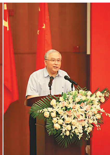
首旅集团党委书记、董事长段强致辞。