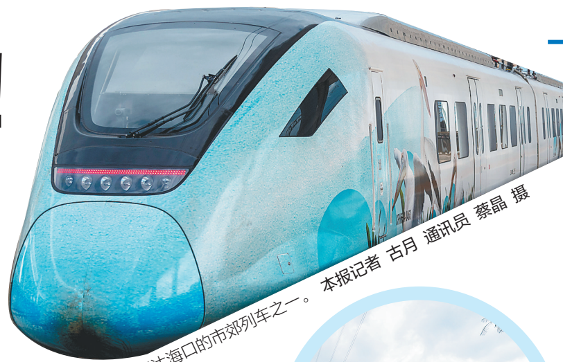
首批抵达海口的市郊列车之一。本报记者 古月 通讯员 蔡磊 摄

29日下午在海口站短暂停留后,16时45分,首批到达的2列列车驶离站台。据现场工作人员介绍,另外2列列车也于29日傍晚到达海口。4列市郊列车将开往三亚动车所进行调试、整备、检修工作。