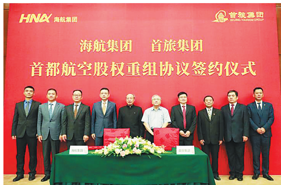
签约仪式上,海航集团和首旅集团领导合影。