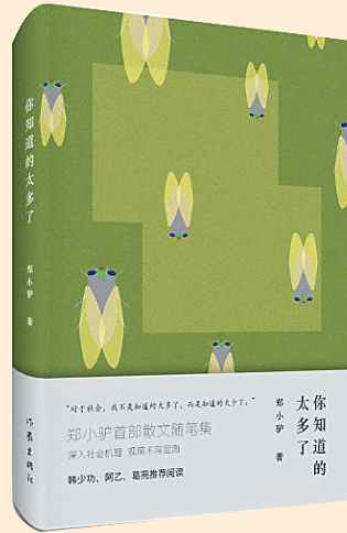
郑小驴作品《你知多少》