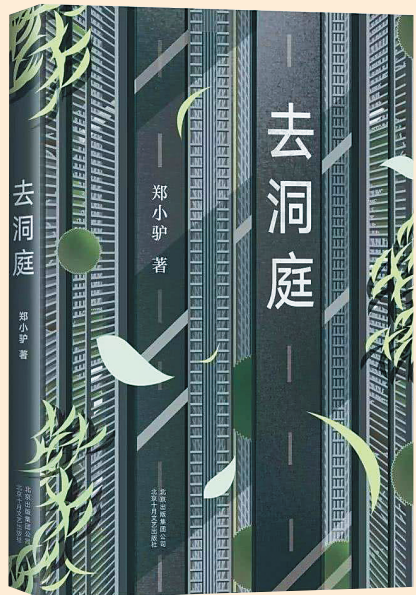
郑小驴作品《去洞庭》