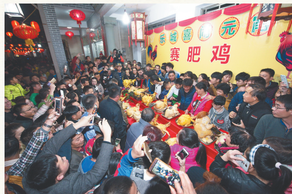
2017年2月11日,乐城肥鸡擂台赛盛况。