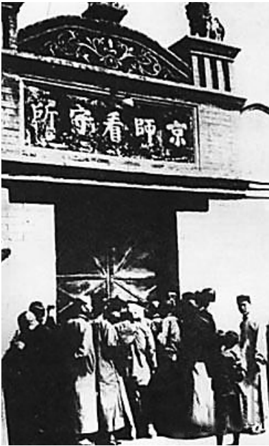
图为莫同荣壮烈牺牲的地方：北京西交民巷司法部后街京师看守所。