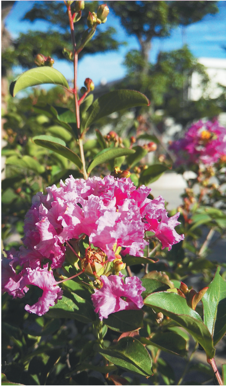
小叶紫薇的身影在海南多地都可见到。

与大个头的大叶紫薇不同，小叶紫薇无论是树高、花朵还是叶子都小巧得多，气质更为平易近人的它在悄无声息中打破“花无百日红”的魔咒，牵起一场枝头上的紫色风暴。