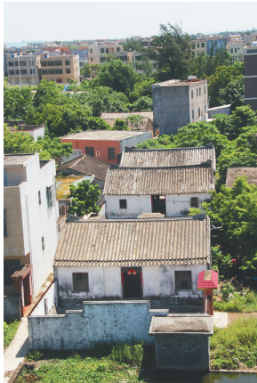
现存一排三进的櫓梧村林家老宅左右厢房已经基本倒塌。