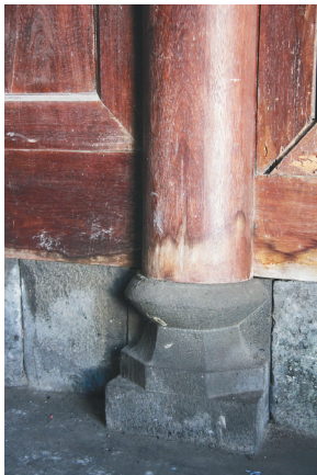
櫓梧村林家老宅古旧的石柱础和实木柱。