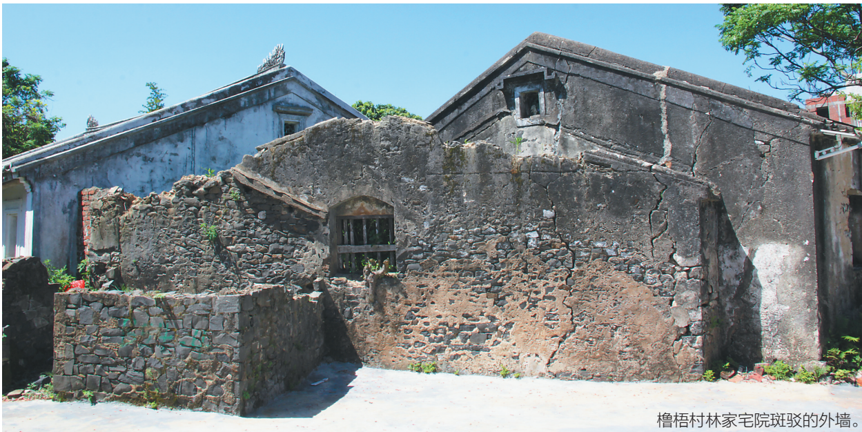
櫓梧村林家宅院斑驳的外墙。

海口市南渡江东岸的美兰区灵山镇仲恺村委会有一个古老而神奇的村落——櫓梧村，其历史可追溯到一千多年前，据《琼州府志》和林氏谱牒记载，1000多年前，唐代福建福清人林裕乾宁年间(894–898)“赐进士及第”后，于光化二年(899年)，奉敕渡琼，上任琼山知县，夫人陈氏和儿子林堂随行。