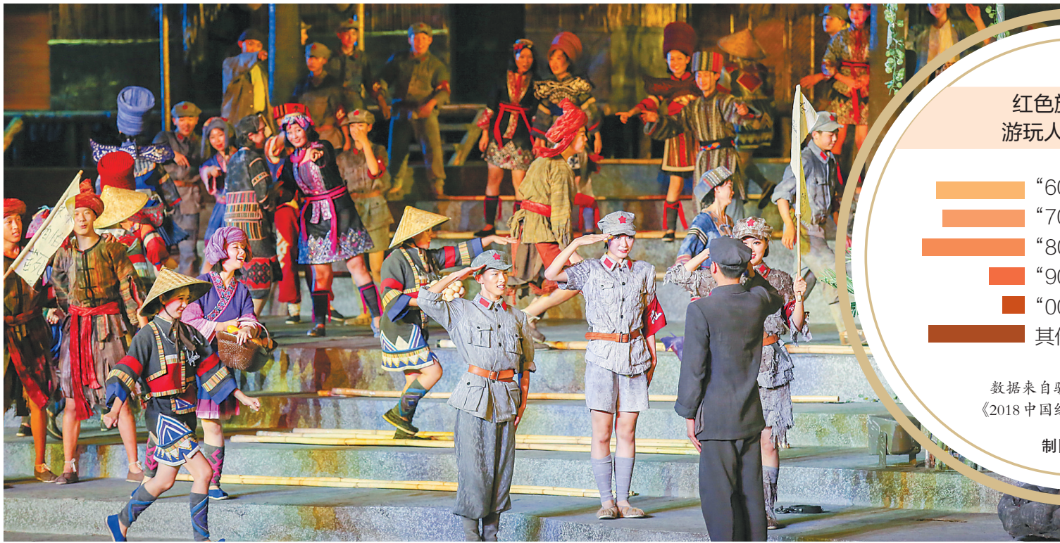
红色旅游目的地 游玩人群年龄占比