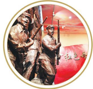
母瑞山革命根据地纪念园。

海南丰富的旅游资源中,不能忘记那一束跳跃的火红:23年红旗不倒、红色娘子军、海南岛解放……海南拥有庞大的游客数量,在全域旅游的大背景下,如何对红色旅游资源进行再开发、再利用,进一步拓展旅游消费空间,值得探讨。