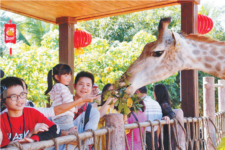
游客在海南热带野生动植物园游玩。

平台,上架旅游产品,为客户提供多元化选择。“之前的团队游产品都是机票加酒店加景区门票加团队餐,现在旅行社也对酒店、景区等进行单项包装,给游客更多自由度,避免传统跟团游的束缚。”孙相涛说。 传统旅行社“上线”,线上旅游平台携程则进驻海南,开设线下门店,瞄准了海南客源市场。“海南作为旅游目的地,各大在线旅游平台为海南输送了大量中高端客户。而在组团和出境市场,我们瞄准线下市场巨大的客户群体,希望为海南本地中高端市场提供更多样化的产品。”携程渠道事业部海南区域总经理黄文忠告诉记者,随着线上线下产品库的对接,旅行社在携程旅游门店为游客提供了更加丰富的产品选择:不仅有出发地参团、目的地参团、半自助、私家团等跟团游产品,还引入了线上平台的自由行、定制游、主题游等产品,而携程标准化的管理和品质化的服务也将给游客崭新的体验。