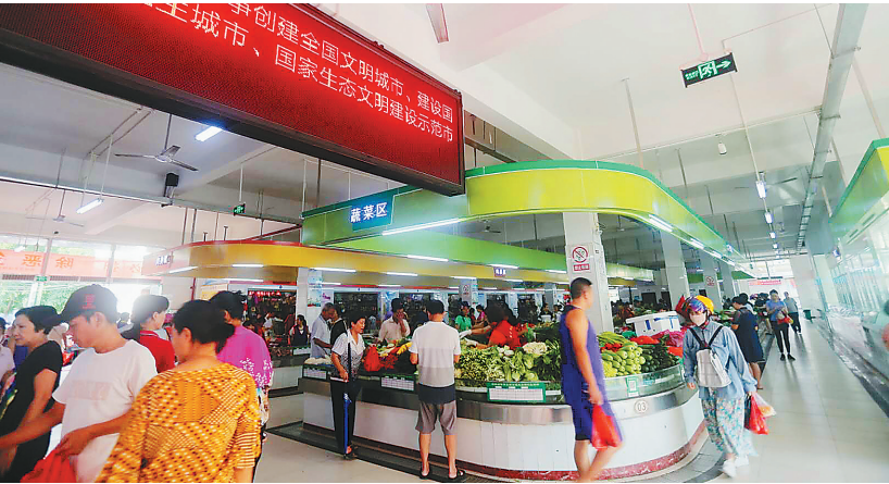
整改后干净有序的农贸市场。

一年半的时间里，儋州坚持以社会文明大行动为引领，聚力国家卫生城市创建，科学筹划国家生态文明示范市建设，紧紧围绕创建标准和目标任务，全市上下勠力同心、多措并举，城市面貌焕然一新，城市文明程度明显提高。