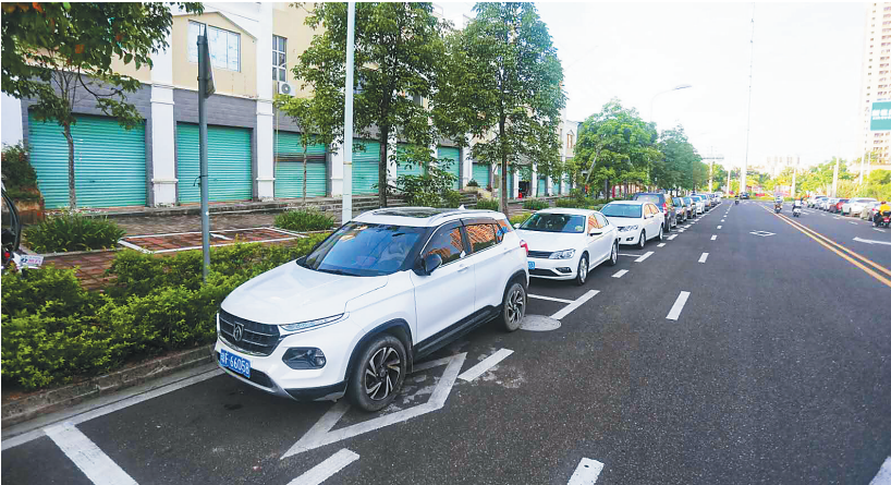
儋州划线规范停车。