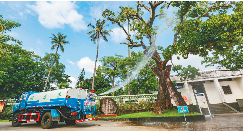
儋州园林工作人员洒水对景区的绿化进行浇灌，管护园林环境。