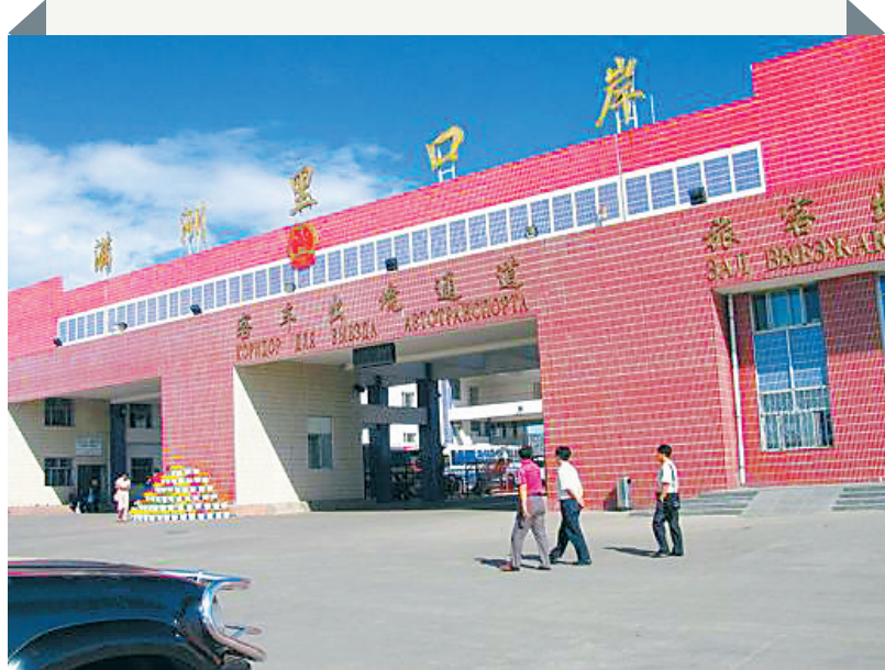
满洲里口岸物业服务中心。

近期，国办督查室派员赴内蒙古满洲里口岸明察暗访，发现满洲里口岸存在违规乱收费、变相涨价收费等问题，大幅增加企业成本，抵消国家减税降费效果。