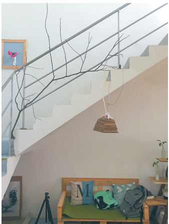
楼梯扶手上镶嵌着捡来的树枝,灯罩是用纸皮做的。