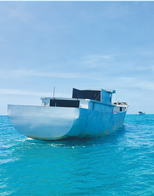
采用高效环保钢质船体打造而成的人工渔礁。

深远海立体、循环、生态养殖模式,已成为我国水产养殖的重要方向。对此,普盛海洋公司将在现代