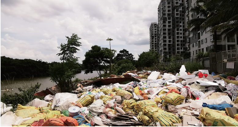
7月12日,临城镇文澜江畔垃圾成堆。本报记者 陈元才 见习记者 李天平 摄

记者在6号桥走访时,有当地居民透露,在6号桥南侧有一个更大的垃圾堆,就在锦绣大道边。根据指引,记者果然发现有一个面积达数百平方米的垃圾堆,渣土里夹杂着塑料袋、包装盒、碎砖头、断木板等各种废弃物,距离锦绣大道仅十几米远。 打听到这个垃圾堆在临城镇文书村的地界上,于是记者驱车来到文书村。该村一位包点干部说,那里本来是片坡地,锦绣大道通车后,开始有人在夜里偷倒建筑垃圾,但不是文书村的村民。由于那里离村中心比较远,不属于村保洁责任区,村里曾于2017年在该处立过禁止倒垃圾的警示牌,但没有效果。并且垃圾堆所