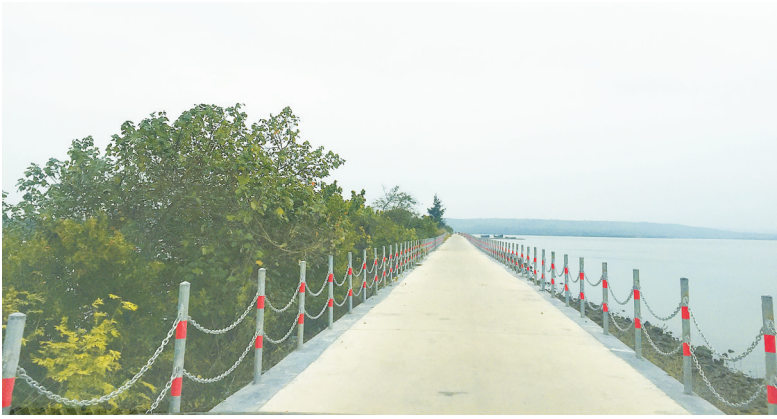
和贵村后水湾畔防波大堤干净整洁。

“堵源头,弃库存。”7月13日,杨勇宏向海南日报记者介绍工作队的人居环境整治经验。“堵源头”就是加大乡村卫生教育宣传,改变村民乱扔垃圾的不良习惯,树宣传牌,村广播站早晚广播,工作人员入户宣传。“弃库存”就是彻底清理道路两侧,村内以及红树林里的陈年垃圾。 人居环境整治是个苦差事。为激发党员的先锋模范作用,杨勇宏一个多月里开了4次党小组会议。在环境卫生整治中,党员率先垂范,带动群众共同参与到环境卫生整治中来。半个多月中,众人每天清理3小时,将道路两侧成堆的建筑垃圾和生活垃圾一一清理,把防风林里的生活垃圾打扫干净,红树林海面上飘浮的垃圾也被他们用小船打捞干净。