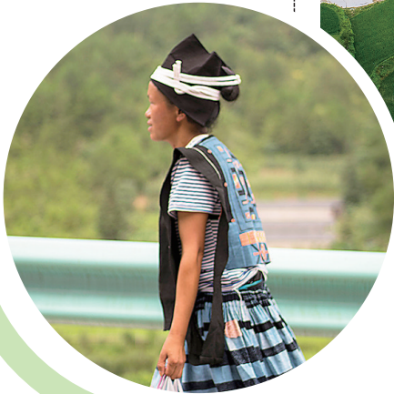
快步赶集的瑶族乡民。