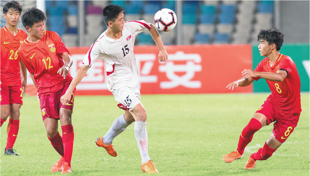
图为中朝比赛中，朝鲜队球员疑似手球，但裁判员没有判罚。

过了40米，堪称“世界波”。最终，朝鲜队3:1战胜了中国队。 本次比赛的4支球队均已亮相，朝鲜队球员身高、速度、力量、技术高人一筹，是夺冠的最大热门。20日19时30分，中国队将迎战马来西亚队，中国队若想在本次比赛中取得理想的名次，此战必须获胜。不过，鉴于马来西亚队首战2:0力克伊朗队，中马之战中国的足球小将难免要踢一场“苦战”。 本次赛事采取公益形式，大中小学生将免费观看本次比赛，以此吸引更多的海口青少年参与足球运动。 本次比赛由中国足球协会主办，海口市旅游和文化广电体育局、海南省足球协会、海口市足球协会承办。