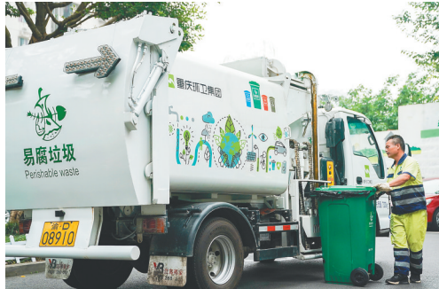
重庆市九龙坡区二郎街道钢球小区内，一辆专用易腐垃圾运输车在装载小区已经分类好的易腐垃圾。

据新华社重庆7月20日电（记者陶治）记者近日从重庆市城市管理局获悉，为扎实做好垃圾分类工作，重庆市在强化分类投放试点工作的基础上，着力推动垃圾分类运输和分类处置体系建设，避免垃圾“先分后混”的情况出现。