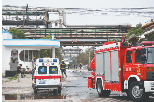
这是7月20日拍摄的爆炸救援现场。

新华社北京7月20日电（记者叶昊鸣）记者20日从应急管理部获悉，截至当日16时，河南义马气化厂爆炸事故已造成12人死亡，3人失联，13人重伤。目前，现场270余名消防救援人员已完成3轮搜救。