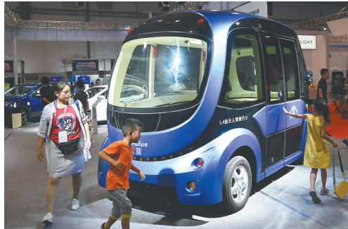
7月20日，参观者在2019中国国际消费电子博览会汽车展区了解一款无人驾驶巴士。 2019中国国际消费电子博览会7月19日至22日在青岛举行。博览会从吃、住、行等多方面描绘了智慧生活蓝图。