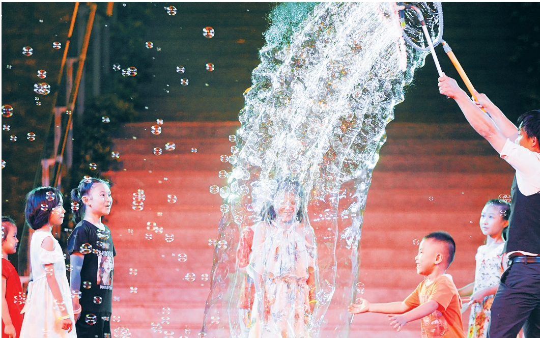
活动表演现场,泡泡表演艺人在舞台上与小朋友们进行互动。

动画诞生于法国,成熟于美国,但技术原理却源于中国皮影艺术。草创时期的卡通动画以短片为代表,其本身带有前卫的实验性质。直到沃尔特·迪士尼的出现,才推动了世界动画这一电影事业的发展与繁荣。