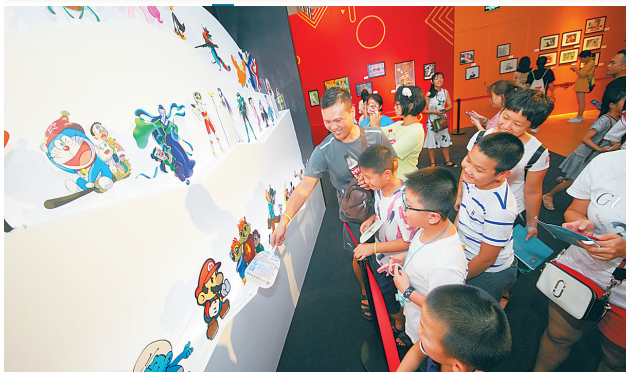
家长们在为孩子们介绍经典的动漫卡通形象。