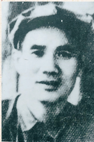
年轻时的林吉祥身材魁梧,相貌堂堂。