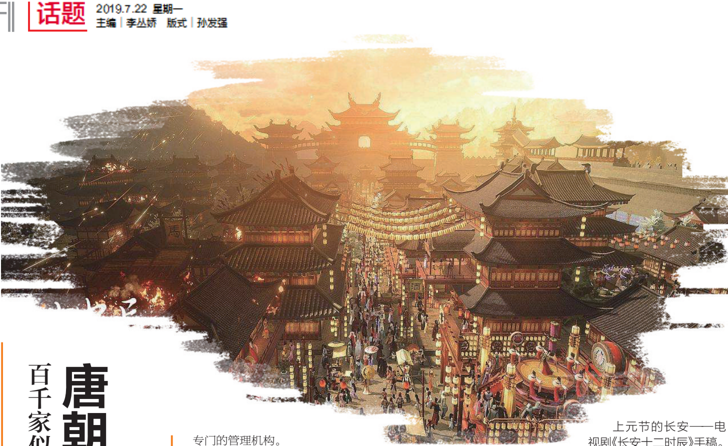
上元节的长安——电视剧《长安十二时辰》手稿。

皇城位于宫城南边,仅有一街之隔,规模与宫城大致相近,是中央政府机构所在地,共有六个城门,其中南面正中为朱雀门,面对整个长安城的中轴线朱雀大街。朱雀大街最宽达155米,长5020米,将长安城分为东西两个部分。纵横交错的道路将棋盘式的外郭城分为110坊。其中一坊又分为4区,每区内又有十字巷,使得整座坊划分为16个小块,中间分布着民宅、官邸、寺院、道观等。同时,在外郭城还有东市和西市两座市场。东市周边多皇室贵族和达官显贵住宅,因此市场多经营各种奢侈品。西市则更多面向普通百姓,以“肆”为单位对商品分门别类进行交易,相比东市而言更为繁荣,因此被称为“金市”。市场内设置市局和平准局作为