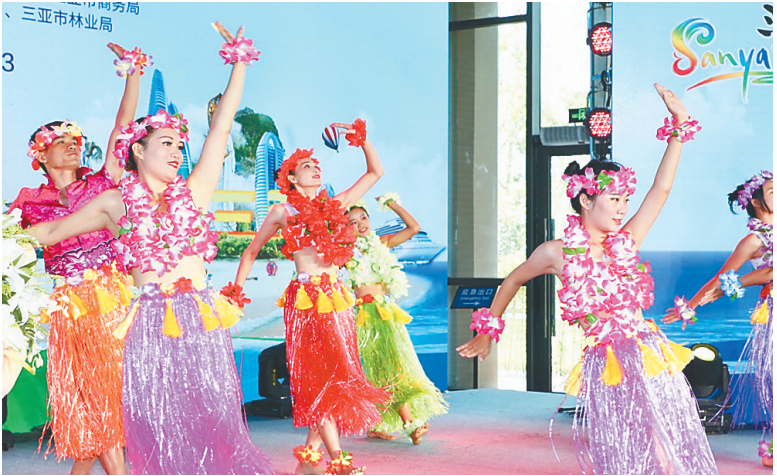
世园会“三亚活动日”启动仪式上的开场舞表演《请到海南来》。

丽的海滨风光，旅游资源品类丰富，一系列数据说明三亚深受国内外游客喜爱。目前，三亚积极培育和发展免税购物、邮轮游艇、会展婚庆、亲子康养等旅游新业态。