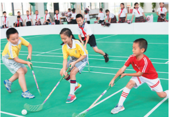
深受学生喜爱的旱地冰球课。