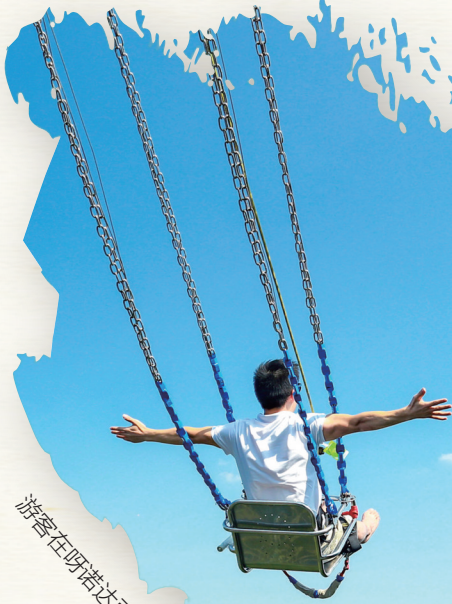
游客在呀诺达雨林文化旅游区体验悬崖秋千。