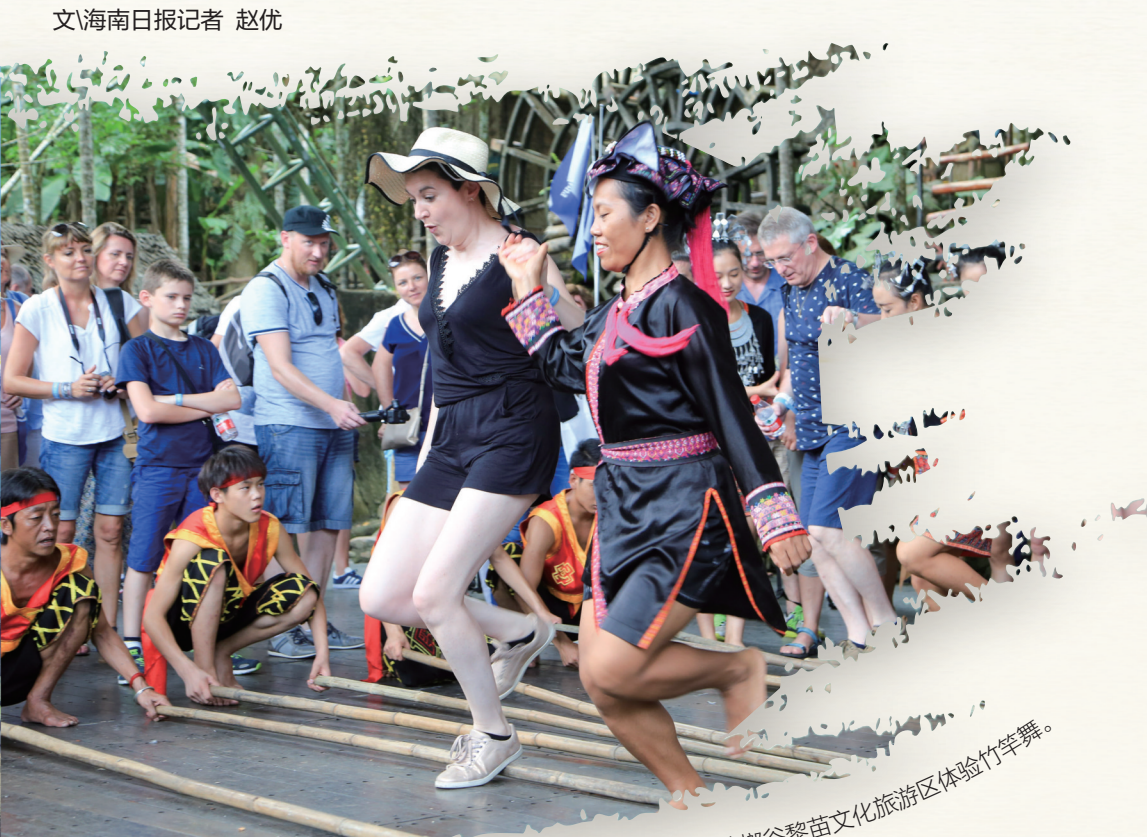
游客在槟榔谷黎苗文化旅游区体验竹竿舞。