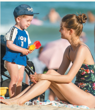
外国游客在三亚大东海海滩休闲。

从当时仅有天涯海角等几个景区到如今几十个形态各异的景区，数十年来，在一代代旅游人的不懈努力下，海南旅游产业得到迅猛发展，不断丰富和升级的旅游景区，也成为承接国内外游客旅游度假需求的重要载体，继续书写着海南旅游的重要篇章。