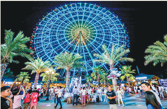
游客夜游三亚海昌梦幻海洋不夜城。