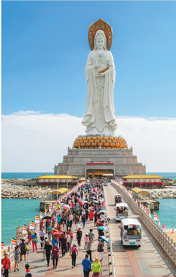
三亚南山海上观音像。