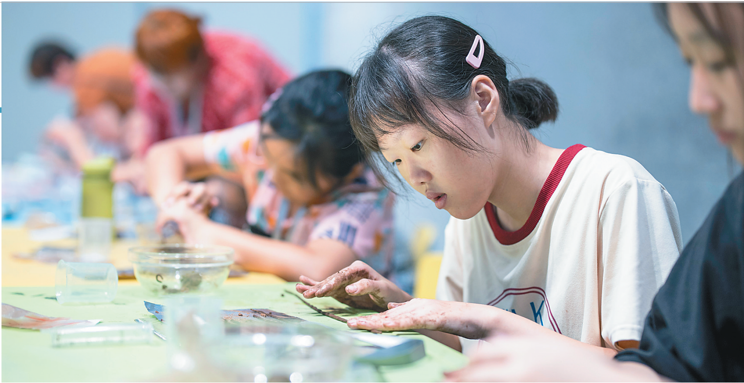
近日，孩子们在省博物馆体验木色生香——沉香线香手工制作课程。

今年暑期，省图书馆、省博物馆等我省公共文化服务机构和多个青少年活动中心纷纷向公众提供公益免费培训或优惠培训课程，吸引我省众多青少年参加。