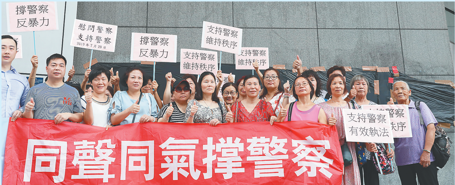
日前，香港市民在香港警察总部慰问警队。