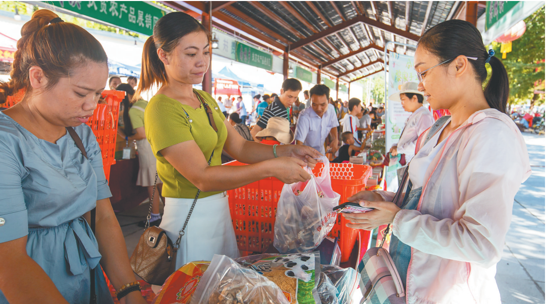
图为消费者在活动现场选购扶贫农产品。

据悉,2019年嬉水节美食购物嘉年华消费活动是保亭品牌节日——七仙温泉嬉水节的重要组成部分,该活动由保亭县政府主办,保亭县发改委和海南日报报业集团全媒体运营中心承办,得到了海南银行保亭支行、保亭金威科技开发有限公司的支持。