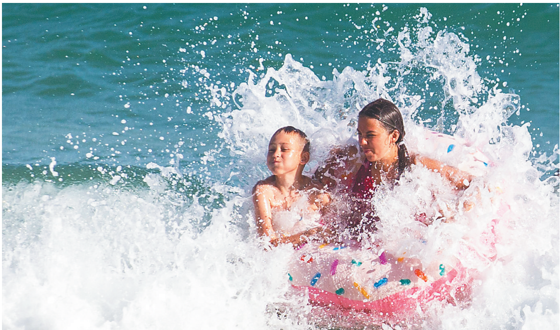
游客在三亚大东海嬉水。

就在同一天,2019 三亚首届帐篷节在亚龙湾国际玫瑰谷开幕,来自省内外外的市民游客齐聚一堂,体会在