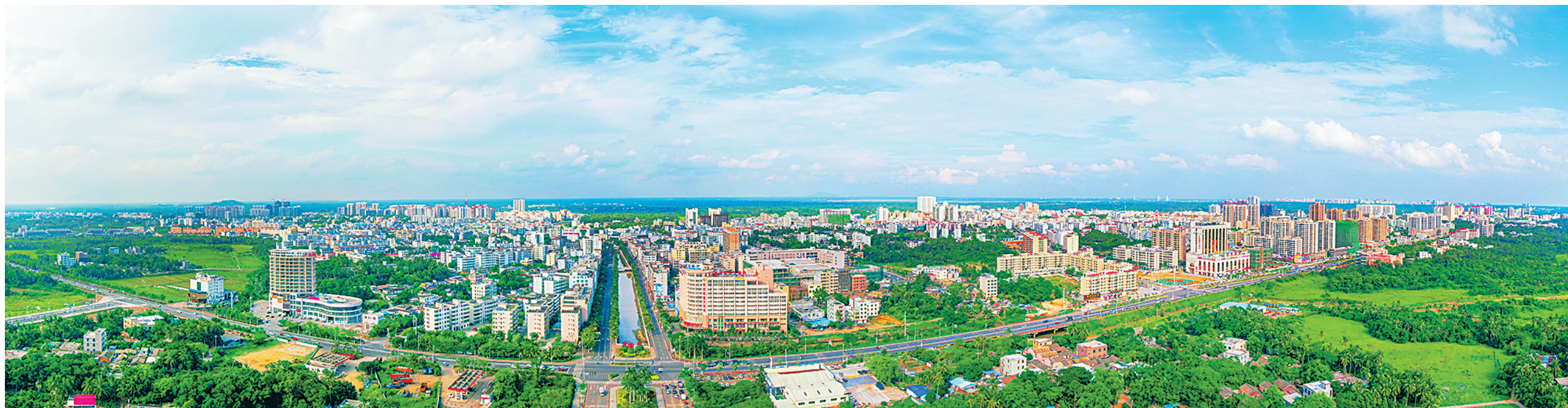
俯瞰文城。