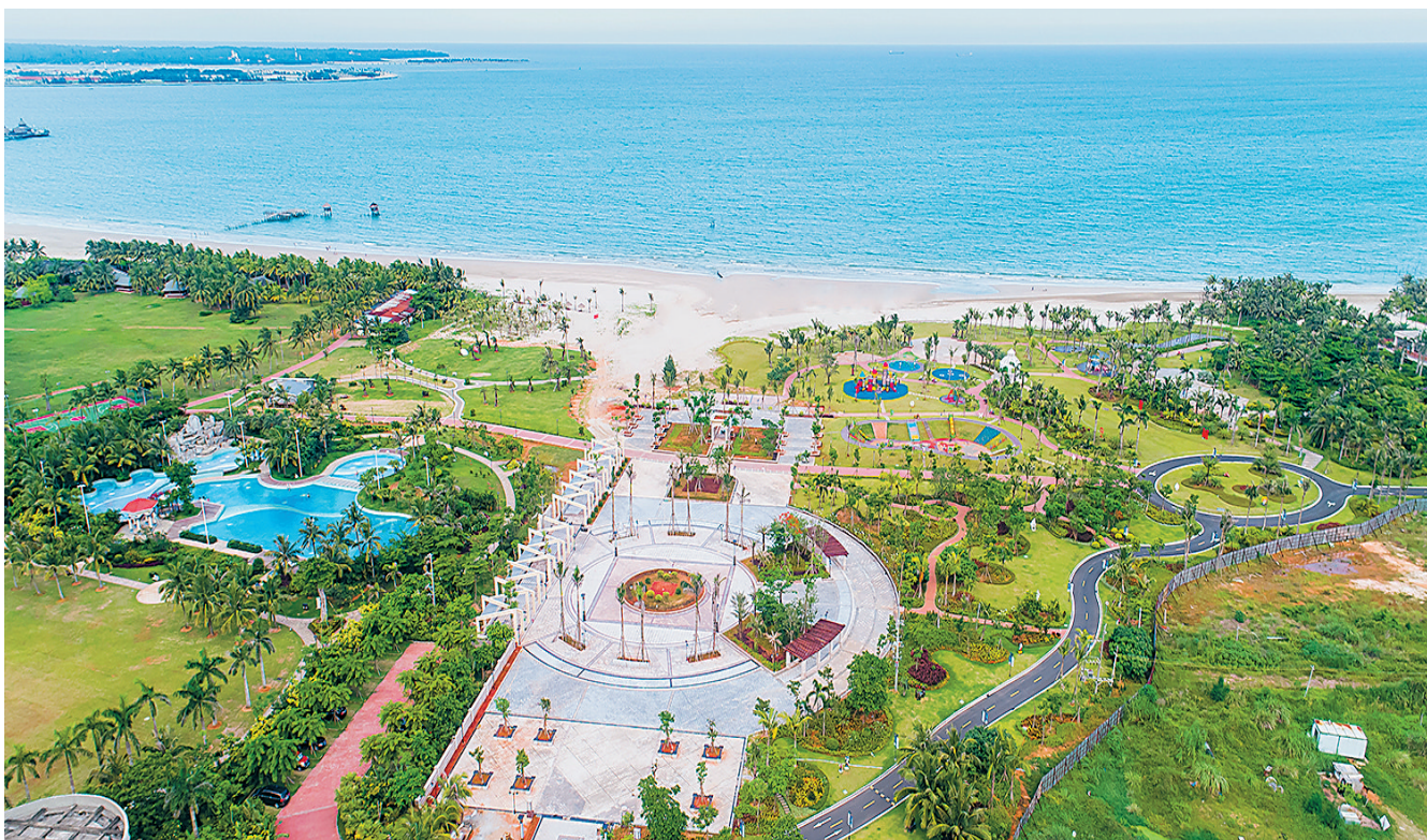
文昌清澜市政公园。