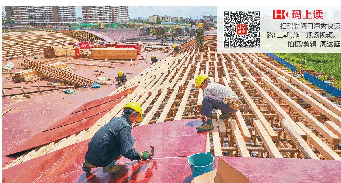
8月27日，在海口海秀快速路(二期)项目施工现场，工人正在抓紧施工。

(二期)已初现雏形。“目前我们全线共有450余人全力奋战保进度。”海秀快速路(二期)项目技术负责人卢国庆告诉海南日报记者，截至目前，项目已完成固定资产投资3.7亿元，占总投资额15.88亿元的23%，其中主线桥桩基全部完成，承台完成53.4%，墩柱完成42%，现浇箱梁完成6联，占比18%，整体进度与工期计划安排保持一致。为了顺利推进工程进度，确保施工质量，海秀快速路(二期)项目引进了新技术、新工艺、新材料和新设备。“我们使用的全自动破桩头机和泥浆处理机等新设备，在海南省市政工程中属于首例。”卢国庆说，项目共1400多根桩基采用全自动破桩头机，在提高破桩头效率的同时，大大减少了人工投入。采用泥浆处理机，则有效解决桩基泥浆污染问题，实现节能减排、绿色环保施工。而大规模引进的墩柱与安全爬架组合模板及叠扣式满堂支架，则将承载能力提升到以往的二到三倍，效率提高两倍以上。“为加快推进海秀快速路(二期)项目，海口市政府和业主单位城建集团成立了专门的项目协调小组，至少每半个月来项目上服务一次，在管线迁改、土地征收等方面帮我们解决