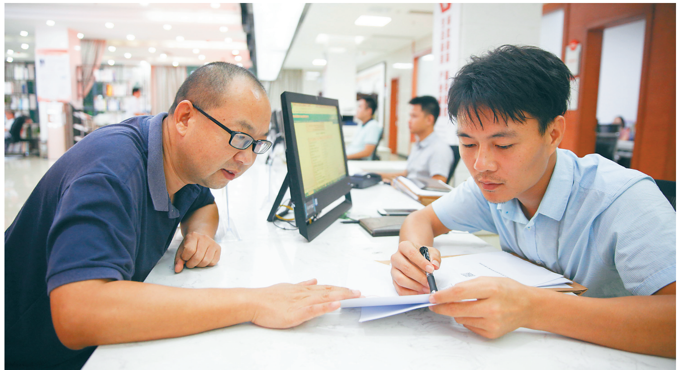
海口国家高新区推行“六个试行”极简审批,服务企业。图为在海口国家高新区政务服务中心,工作人员给前来办理施工许可证的企业代表解答疑问。