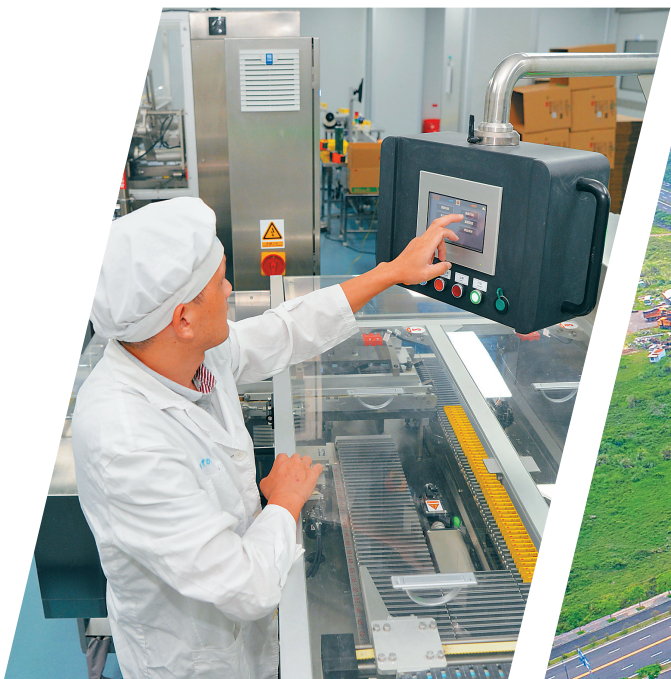
在位于海口药谷的先声药业有限公司,工人们正在生产药品蒙脱石散。