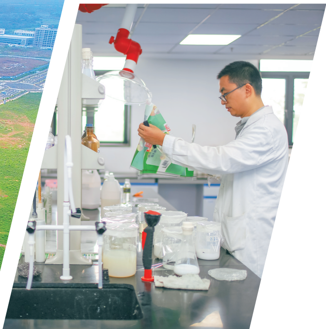
在位于海口国家高新区狮子岭园区的海南赛诺实业有限公司实验室,科研人员正在做实验。