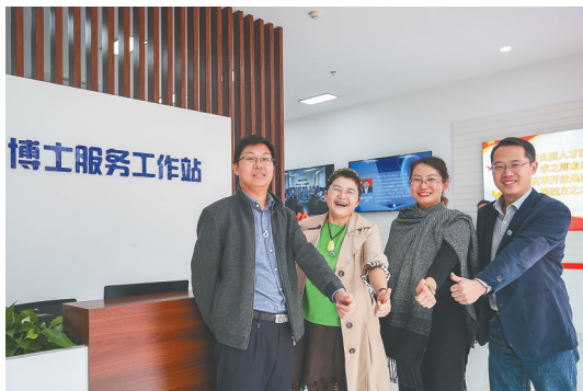
文昌市博士服务工作站。

海文大桥建成通车，进一步拉近文昌铺前与海口的距离；文博高速公路预计于下半年建成通车；红岭灌区东干渠及田间工程、文昌燃气—蒸汽联合循环电厂（一期）、环岛管网文昌—三亚输气管道工程等重大“五网”基础设施项目均按序时进度推进；文昌至临高高速公路文昌段用不到1个月时间完成征地636亩。