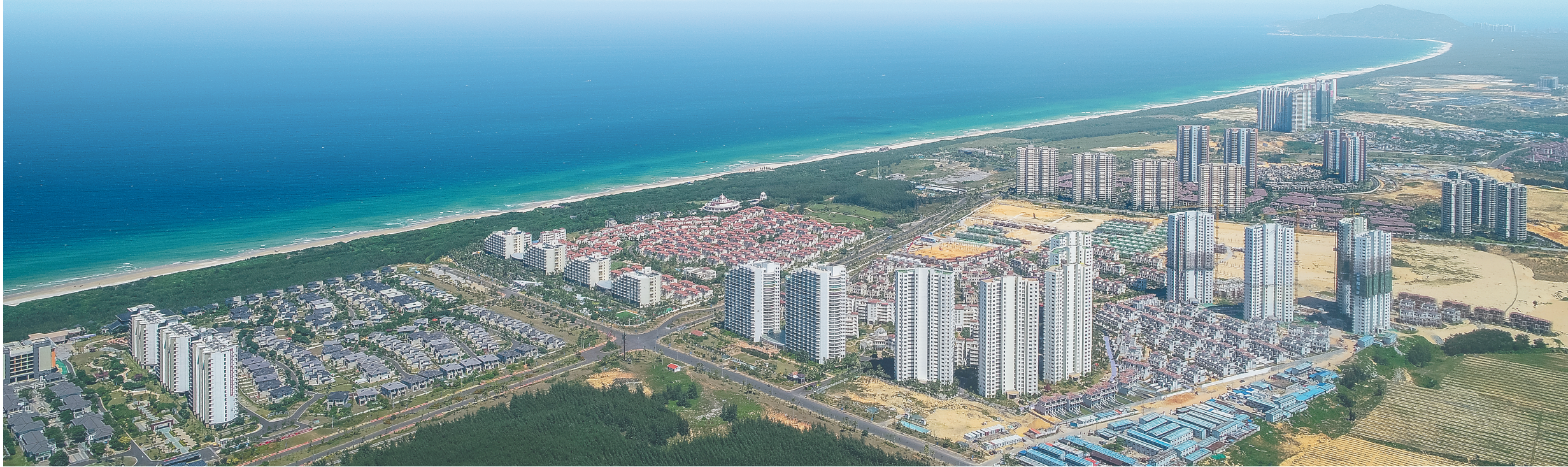
俯瞰位于文昌昌洒镇东海岸的月亮湾起步区。

椰风送爽，山青海碧。随着中国首个开放型滨海航天发射场落地文昌，借力航天品牌优势，文昌迎来前所未有的发展机遇。“我们将始终秉承重商、亲商、扶商的理念，为项目建设提供一流政务服务，营造一流营商环境。”文昌市委书记钟鸣明表示。 文昌紧紧围绕文昌国际航天城的发展定位，坚定不移推动高质量发展，经济运行实现稳中向好的态势。今年上半年，全市实现地区生产总值137.21亿元，完成全年任务的54.7%，增长5.5%；固定资产投资完成100.58亿元，与上年同期持平，比全省平均水平高23个百分点，总量排名全省第三，仅次于海口、三亚，增速排名全省第三，仅次于儋州、白沙，在东部市县中排名第一。