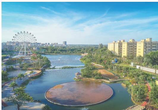
进行水生态综合整治后的文昌霞洞湖水上休闲公园。

此外，文昌今年新增铜鼓岭国际生态旅游区、春光椰子王国两个3A级旅游景区；龙楼镇好圣村被评为五椰级乡村旅游点；潭牛镇大庙村“共享农庄”被评为海南十佳民宿，该村鹿饮溪民宿获得多项国际设计大奖，成为网红民宿。（本报文城9月1日电）